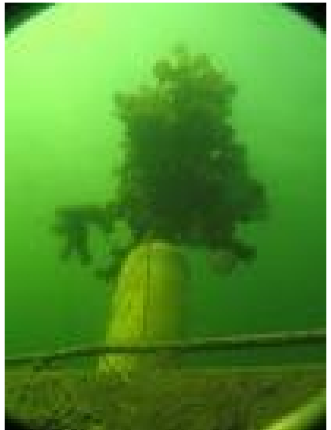
Kerstboom onder water

Voor iedereen fijne kerstdagen en een fantastisch 2010 met veel duikplezier!